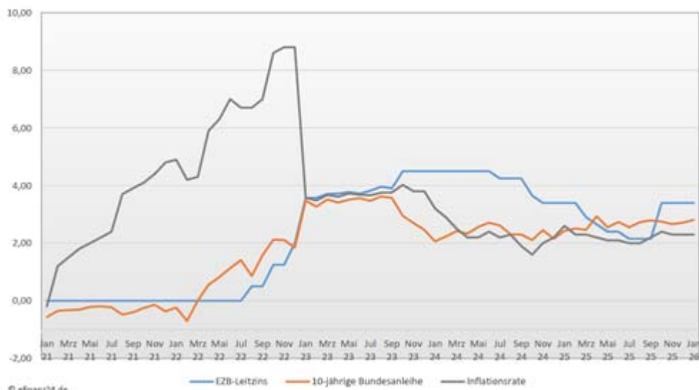
Entwicklung EZB-Leitzins, 10-jährige Bundesanleihe und Inflationsrate Zeitraum Januar 2021 - Januar 2026