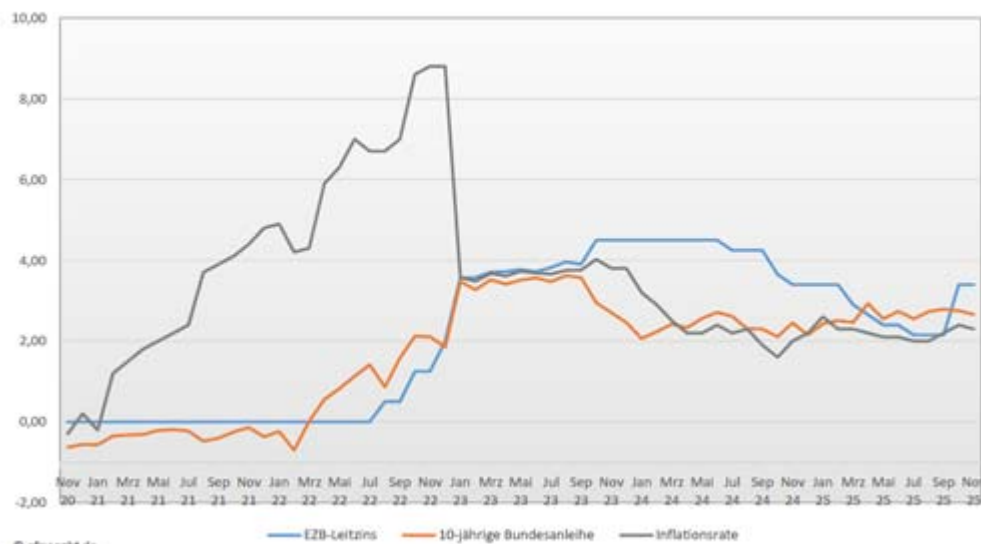
Entwicklung EZB-Leitzins, 10-jährige Bundesanleihe und Inflationsrate Zeitraum November 2020 - November 2025